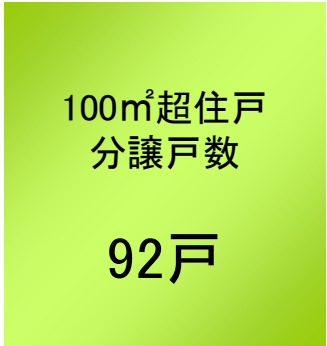
ファインガーデンスクエア 100㎡超住戸の分譲戸数