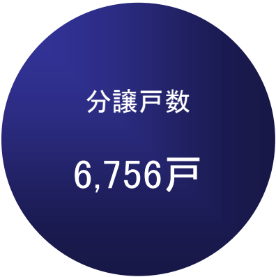
大阪市内の分譲戸数