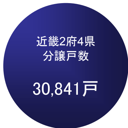
近畿2府4県 の 分譲戸数